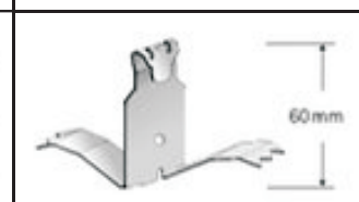
Clip type B

Dilatační profil série KE je určen pro dodatečné zakrytí objektových dilatačních spár v podlahách. Profil se používá k překrytí spár v dilatačních polích a zároveň k ochraně jejich hran. Používá se především do výrobních hal, skladových prostor a komerčních budov. Viditelná část profilu je 60mm až 90mm. Profil se vyrábí v přímé nebo rohové variantě pro použití ke zdi.